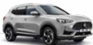
Medal Silver (metallic)