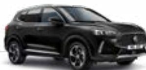
Pebble Black (metallic)