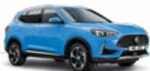
Brighton Blue (metallic)