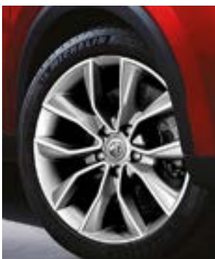
Jante aliaj 18"