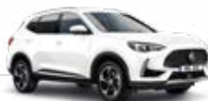
Dover White (non-metallic)