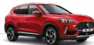
Diamond Red (metallic)