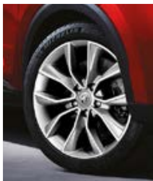
Jante aliaj 17"