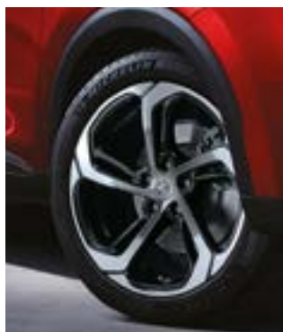
Jante aliaj 17"