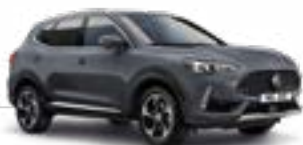
Magic Grey (metallic)