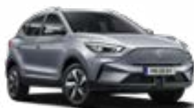
Monument Silver (metallic)