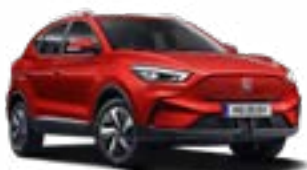
Diamond Red (metallic)