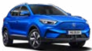
Cosmo Blue (metallic)