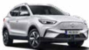
Dover White (non-metallic)