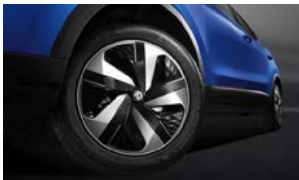
Jante din oțel de 17" + capac Aero