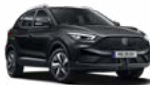
Pebble Black (metallic)