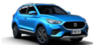
Cosmo Blue (metallic)