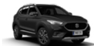
Pebble Black (metallic)