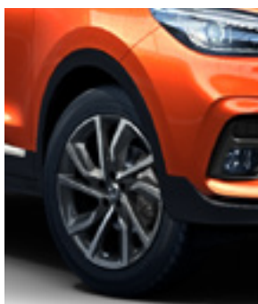
Jante 17" model Active (motorizare 1.0)