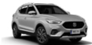
Monument Silver (metallic)