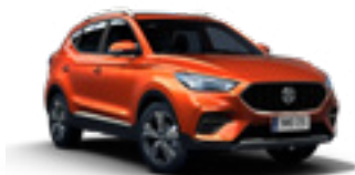
Hexton Orange (metallic)